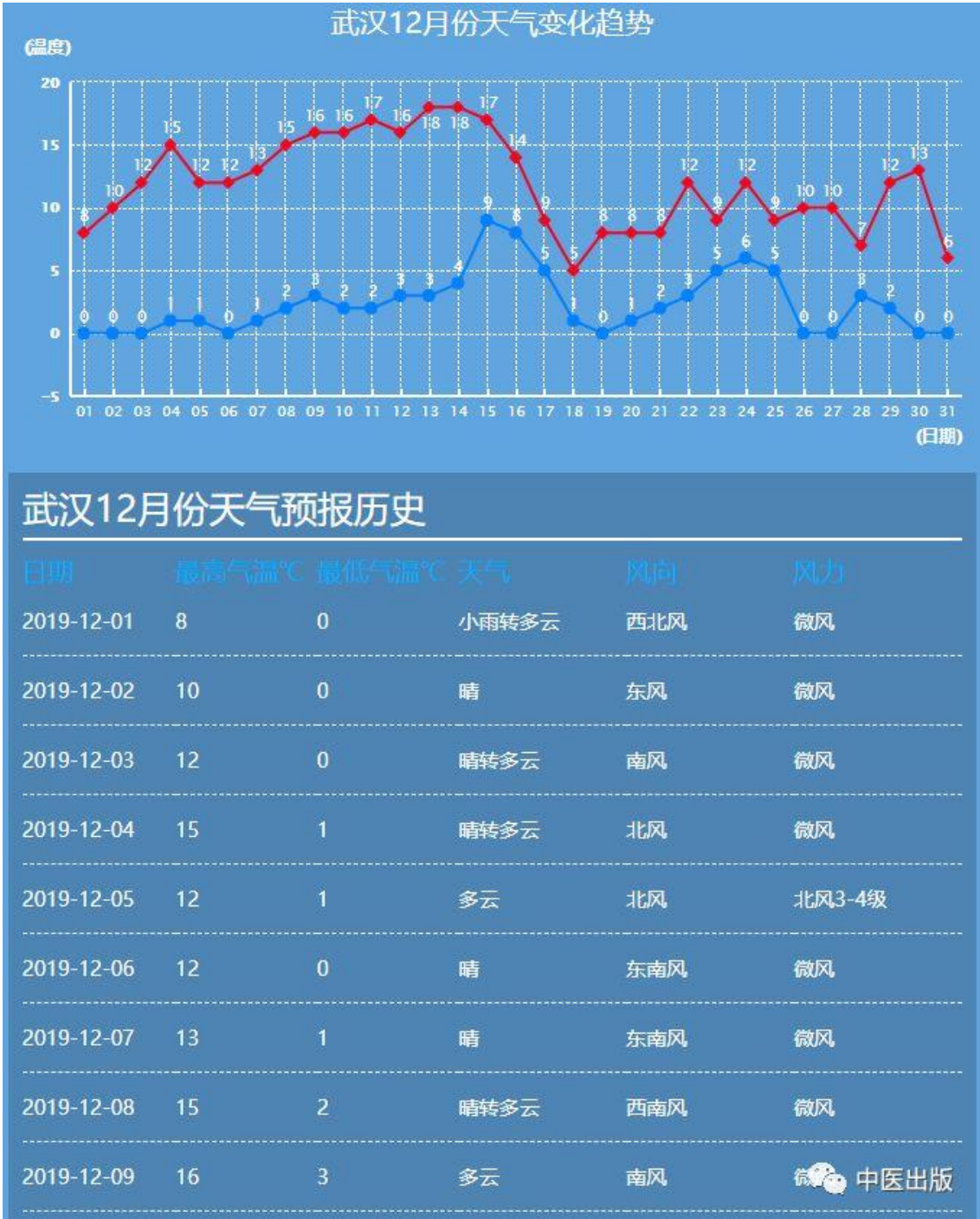
(武汉 2018 年 12 月、2019 年 12 月部分气温表)

在面对这种未知的病毒会让人联想到 2003 年的那场没有硝烟 SARS 之战，虽说我们最终控制了疫情，但也伤亡惨重，而我们现在正面对的可能就是这种类似的有传染性的病毒。